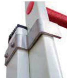
Crochet de sécurité.