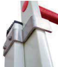
Crochet de sécurité.