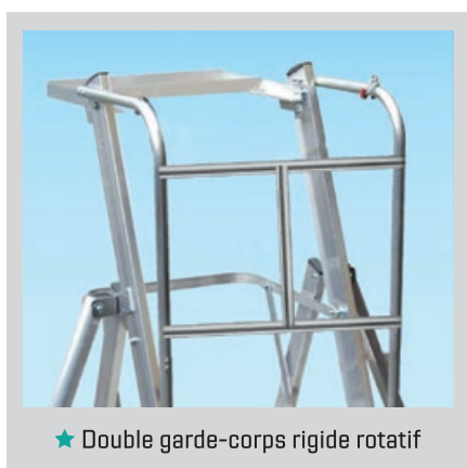
★ Double garde-corps rigide rotatif