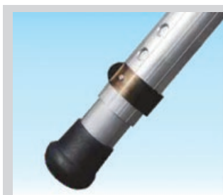
★ Stabilisateurs télescopiques