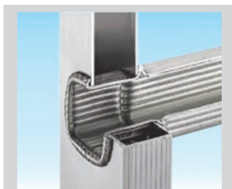
★ Échelon carré 30x30mm antidérapant avec double bordure

FRIG 1980 est un escabeau à plateforme très robuste, équipé d'une large et sûre plateforme de travail conforme aux normes , adaptée aux travaux intensifs. Le système télescopique permet de régler la hauteur de la plateforme et de s'adapter même à des dénivelés importants et aux escaliers , tout en réduisant au minimum l'encombrement lors du transport.