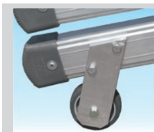
★ Roues 125mm