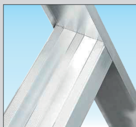
★ Marche antidérapante de 83 mm, avec une soudure d'angle robuste