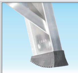
★ Sabot antidérapant