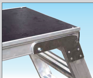
★ Charnières robustes en aluminium avec fermeture pliante

Compacte, légère et durable, elle est idéale pour les travaux rapides et sécurisés à faible hauteur.